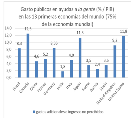
Gráfico 1 : Gastos públicos adicionales por el covid 19